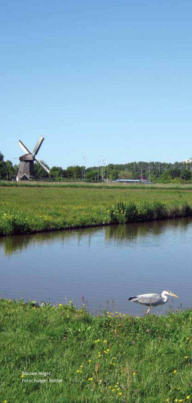
Blauwe reiger