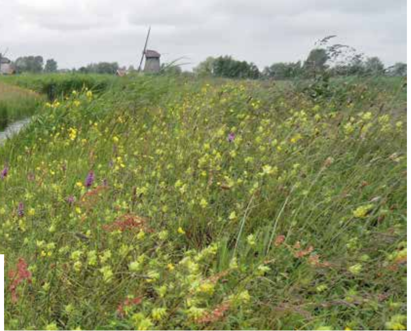
Ratelaar langs de waterkant

(1) Links naast het bruggetje staat strijkmolen C, de molen die twee keer is afgebrand, maar weer fraai is