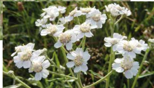
Wilde bertram

We lopen echter iets terug naar het westen langs de fundamente van de Nieuwburg. Bij de brug staat een informatiebord met de geschiedenis van de Nieuwburg. (8) Ook hier zijn strategische plekken om naar de weidevogels te kijken. De bermen staan zomers vol met grote ratelaar, wilde bertram, smalle weegbree en rietorchissen.