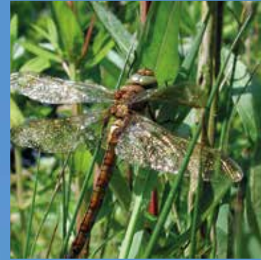
Ijsvogel en vroege glazenmaker

Sinds 2016 heeft ook de ijsvogel in de Oudorperhout een territorium. De luide roep is vaker te horen dan de vogel zichtbaar is. Het weiland aan de rechterkant van de brede sloot is enige jaren geleden afgeplagd en al snel verschenen hier de eerste orchideeën. Nu worden er minimaal twee soorten gevonden. De meest voorkomende is de rietorchis, maar er staan ook veel brede orchis die een maand eerder in bloei komen. Jonge weidevogels vinden hier nog het meeste voedsel. De poel die u kunt zien is een belangrijk paargebied voor rugstreeppadden. De kleine slootjes langs de paden herbergen diverse libellen en waterjuffers. De grote keizerlibel en de vroege glazenmaker vallen het meest op.