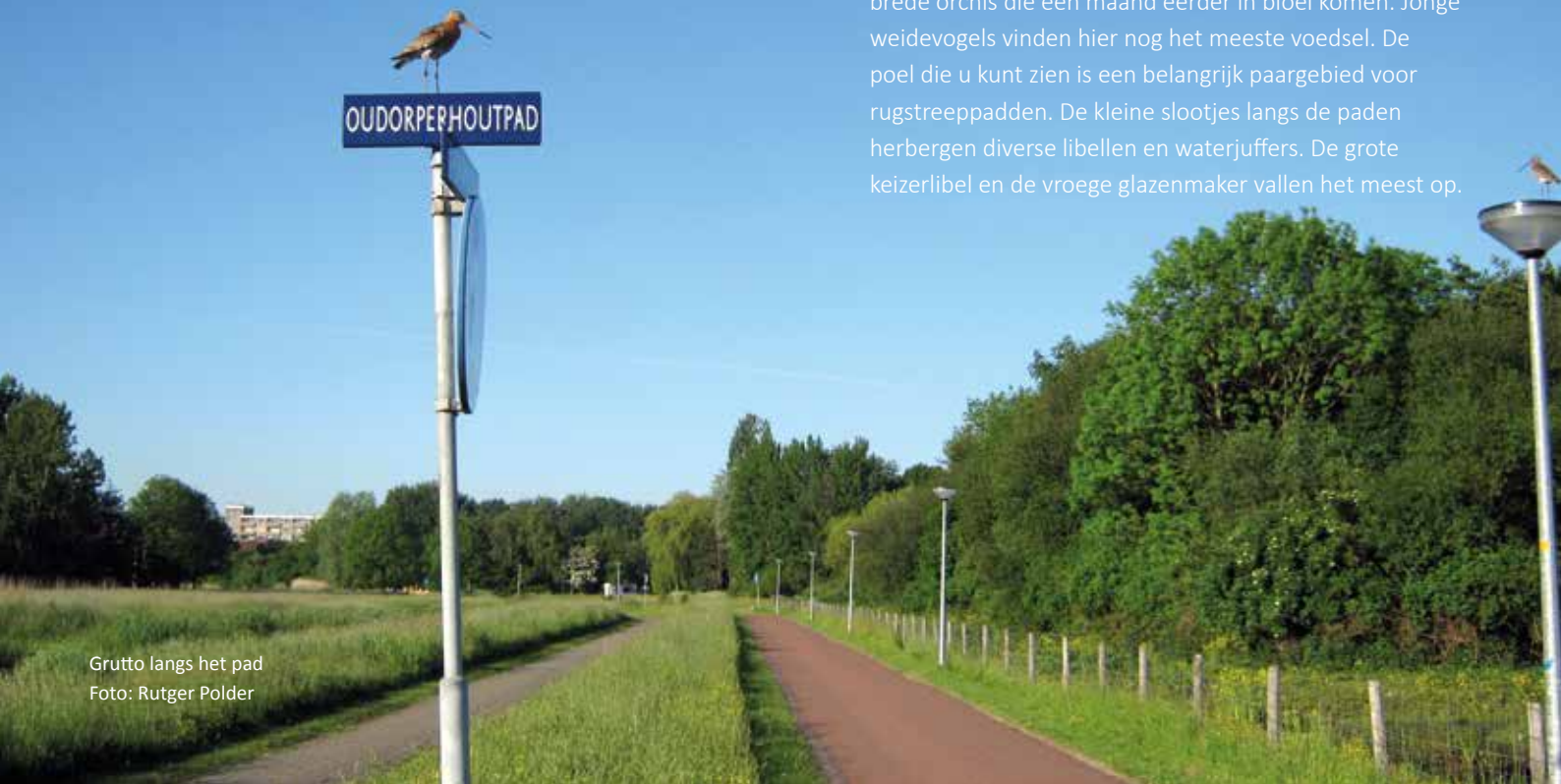
Grutto langs het pad

Sinds 2016 heeft ook de ijsvogel in de Oudorperhout een territorium. De luide roep is vaker te horen dan de vogel zichtbaar is. Het weiland aan de rechterkant van de brede sloot is enige jaren geleden afgeplagd en al snel verschenen hier de eerste orchideeën. Nu worden er minimaal twee soorten gevonden. De meest voorkomende is de rietorchis, maar er staan ook veel brede orchis die een maand eerder in bloei komen. Jonge weidevogels vinden hier nog het meeste voedsel. De poel die u kunt zien is een belangrijk paargebied voor rugstreeppadden. De kleine slootjes langs de paden herbergen diverse libellen en waterjuffers. De grote keizerlibel en de vroege glazenmaker vallen het meest op.